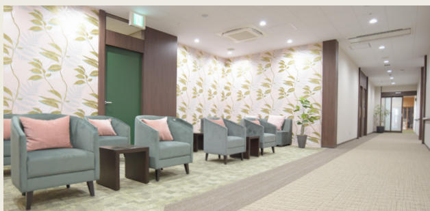
人間ドック待合ロビー

人間ドックエリアを拡張し、 ゆったりとした待合ロビーや更衣室を ご用意いたしました。 内視鏡検査室も新設しましたので、 ぜひご利用ください。